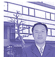
株式会社コンシェルジュ

新ビジネスをめざすインキュベータオフィスビル「ドリーム館」を地元企業と創設。 標準地で実験ビジネスを試す企業にも、オフィスから税務まで総合的に支援します。