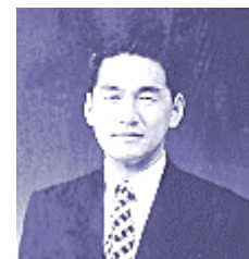
株式会社ペンティス (PENTIS)

デザイン実績...福島県、au、ユーハイム、日本コムシス、JONSON社、 三基商事、トマト銀行、明治生命、大京、東リ、一ツ橋大学MBAコース、 OCC、静岡県伊豆新世紀創造祭、TBSスーパーサッカー、ドナサンド、グラ ンディハウス、伊藤忠商事、毎日新聞、サントリー「モルツ」...他